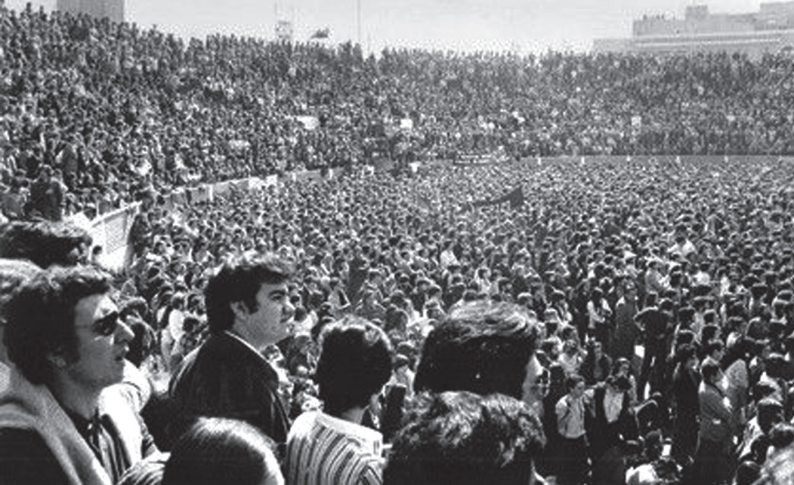
Mitin de San Sebastián de los Reyes en 1977